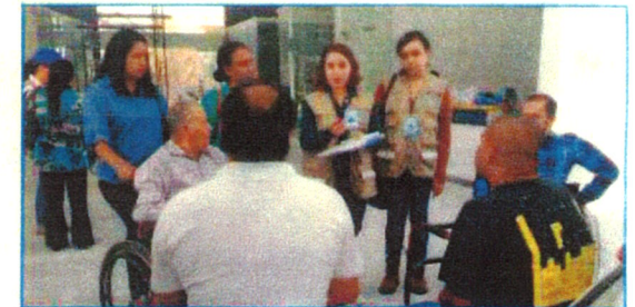
Asesoría al Comité de Contraloría Social en Obra Pública Segunda etapa del Centro Estatal de Rehabilitación del INCDIS Silao, Guanajuato 30 de junio de 2017