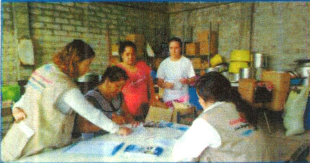
Capacitación al Comité de Contraloría Social en Obra Pública Construcción de cocina y comedor en escuela primaria Miguel Hidalgo Localidad Laguna Prieta, Municipio Yuriria, Guanajuato 07 de junio de 2017

Los COCOSOPS reciben capacitación, asesoría y acompañamiento para realizar un adecuado ejercicio de Contraloría Social.