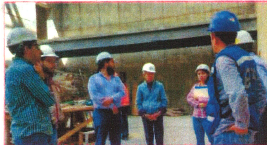
Asesoría al Comité de Contraloría Social en Obra Pública Construcción del Teatro del Parque Urbano de la ciudad de Celaya, Celaya, Guanajuato 27 de febrero de 2017